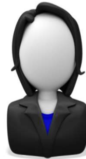
Representantes Escolar Alternos de DELAC