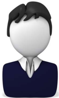
Representantes Escolar de DELAC