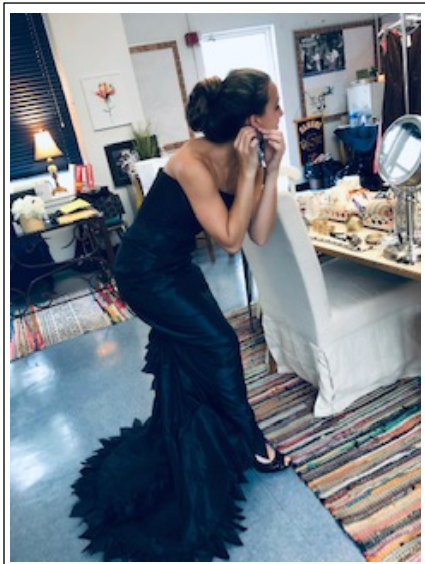
Una cliente de la boutique de Samohi se prepara para el baile de graduación.

¿Tiene un vestido formal, un traje o esmoquin que ya no necesita y sólo ocupa espacio en su clóset? Contribuya para que el baile de graduación de Samohi deje recuerdos memorables y done ropa formal, accesorios, certificados de regalo y ¡hasta efectivo! La boutique del baile de graduación de la preparatoria Santa Mónica High acepta donaciones como vestidos formales nuevos o seminuevos, zapatos, trajes, esmóquines, carteras, joyería y paquetes cerrados de cosméticos y medias; también está aceptando la solicitud de voluntarios que quieran ayudar a los estudiantes a elegir su atuendo. Las personas interesadas en donar tienen hasta el 22 de abril para hacerlo, directamente en el plantel de Samohi por la entrada de la calle 7 y Michigan; no obstante, la escuela estará cerrada del 2 al 17 de abril durante las vacaciones de primavera.