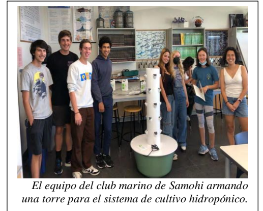
El equipo del club marino de Samohi armando una torre para el sistema de cultivo hidropónico.

SMMUSD está en camino de ser sustentable y ha mantenido su compromiso de educar, implementar y promover la sustentabilidad. No obstante, todavía queda más trabajo por hacer para alcanzar el objetivo del 100% de energía renovable.