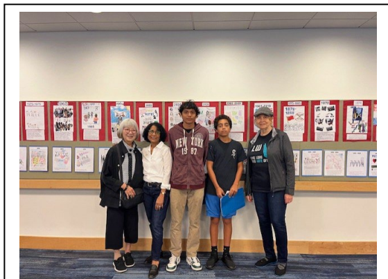
Estudiantes de AVID participan en el evento “Amor por la democracia: por qué votamos”. Están frente a la representación cronológica de los derechos electorales hecha por los estudiantes de 8° grado.