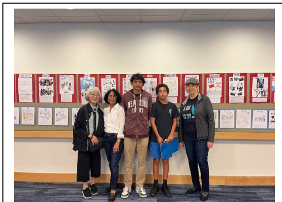
AVID students participating in “Loving Democracy: Why We Vote” event. They are standing in front of the voting timeline made by the 8th grade students

Statewide Student Mock Elections on October 8, 2024, when JAMS students had the opportunity to cast their votes in a simulated statewide election. Prior to casting their votes, the eighth-grade students studied each of the California ballot measures and candidates, discussing both national and local impacts.