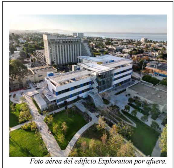
Foto aérea del edificio Exploration por afuera.

Los estudiantes y los maestros ya están haciendo uso del nuevo edificio Exploration y el gimnasio Gold , participando en experiencias académicas innovadoras y disfrutando de los mejorados espacios para educación física y actividades.