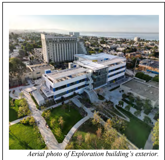
Aerial photo of Exploration building's exterior.

"We are pleased to be in the Exploration building and Gold gymnasium, where students and teachers have been thriving in their new learning environments," said Samohi Principal Marae