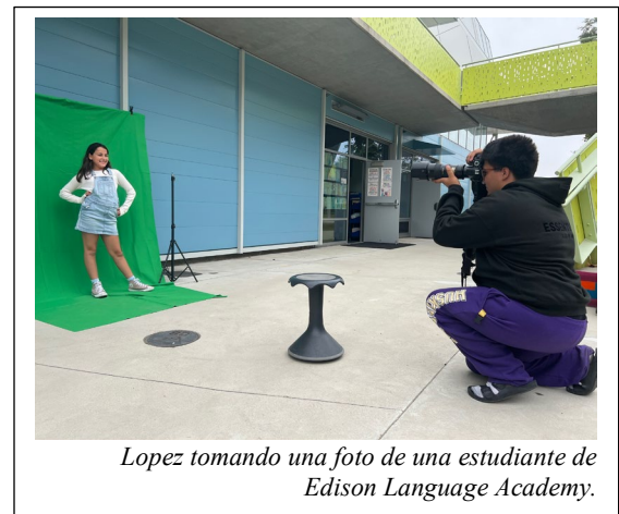
Lopez tomando una foto de una estudiante de Edison Language Academy.

“El no poder jugar fútbol debido a mi lesión me llevó a tomar la cámara compacta de mi mamá para tomar fotos a nuestro equipo de la escuela”, dijo López. “Cuando acabé de tomar las fotos me di cuenta de que disfrutaba haciéndolo y que tenía un talento natural. De ahí continúe probando en diferentes deportes, mejorando cada vez y fue así como supe que deseaba continuar fotografiando a largo plazo”.